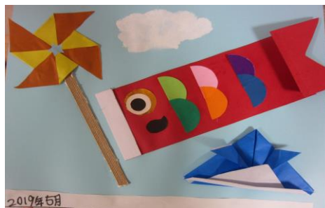
毎月、取り組んでいるカレンダー作り♪ このような作品作りに日々取り組んでいます！