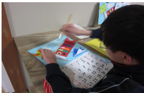
絵の具を使ってステンシル画に挑戦中☆ とても上手にできていますね！！

放課後クラブニコリでは、利用者さん全員が、日々、創作活動に取り組みながら、道具の使い方を練習したり、準備や片付けの習慣などを身につけたり、スタッフとの関わりを通じてコミュニケーションのとりかたを学んだりしています。そのため、日常的に教材として使用している絵の具やのりなどは活動をおこなううえで必需品となるため、イエローレシートのご投函を通じて私たちの活動にご協力いただいた皆様には、感謝の気持ちでいっぱいです。イオンスーパーセンター石狩緑苑台店様、レシートをご投函いただいた皆様、本当にありがとうございました。