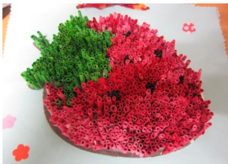
丁寧に1年以上かけて作りました！！