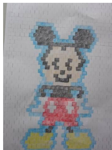
ピクロス風のミッキーマウス♪