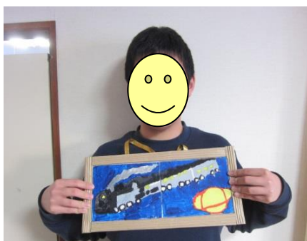
点をつなぐようにして「銀河鉄道」を点描画で描きました！