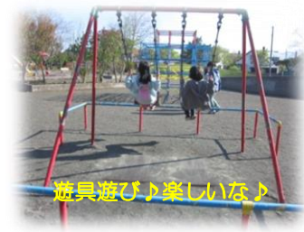
遊具遊び♪楽しいな♪