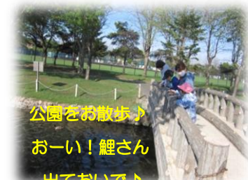
公園をお散歩♪ おーい！鯉さん 出ておいで♪