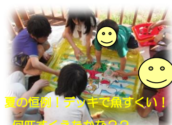
夏の恒例！デッキで魚すくい！ 何匹すくえたかな？？