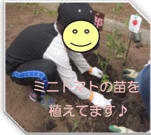
ミニトマトの苗を植えています♪