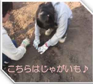
こちらはじゃがいも♪