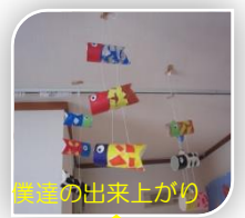
運送の出来上がり