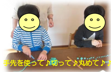
手先を使って♪切って♪丸めて♪♪