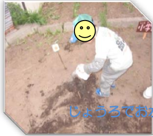
じょうろでお水をあげます