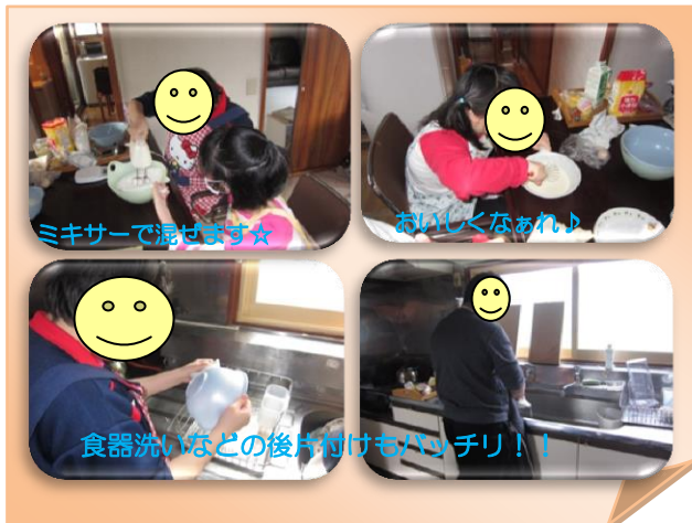
ミキサーで混ぜます☆

創作活動や調理、ゲームなどの設定活動の後は、自由活動として、休憩や趣味の時間を兼ねて、自分なりの過ごし方ができる時間を設けています。キーボードで音楽を楽しんだり、他の利用者さんやスタッフとお話をしたりと個々によって自分らしい過ごし方ができてきて、ちょっと集中して頑張る活動と自由にゆったり過ごす活動といった活動の中でのメリハリもできています。