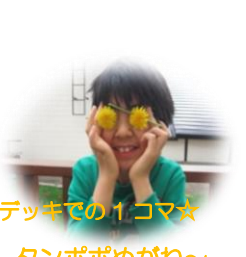
デッキでのイコマ☆ タンポポめがね～