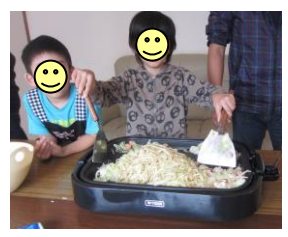
よっ! 焼きそば職人!! コテさばきが最高です。