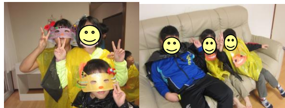
手作りの仮面や衣装で仮装しました！みんな一緒に 「ハイチーズ！」似合ってるね！