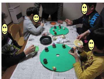
みんなで共同制作☆ クリスマスツリーを制作中です

日々の活動の様子を写真でご紹介します☆小学部、中高部ともにさまざまな活動を行っています。