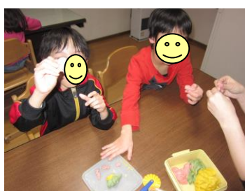
小麦粉粘土遊び♪おもちゃみたいで いい感触♪「こんなのできたよ！」