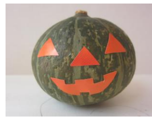
畑で採れたミニかぼちゃ おばけかぼちゃに大変身！