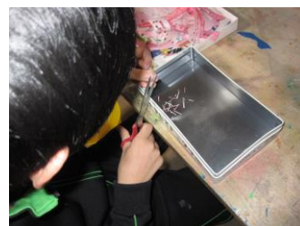
紙を切るのって楽しい！ とても細かく切れています