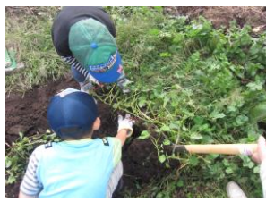
さつまいもどこに隠れているかな? 「おっ! あった、あった!!」

待ちに待った収穫祭では、昨年大好評だった「彩りピザ」「ポテトチップス&さつまいもチップス」を中心に、素材の味を活かした料理を作りました。自分たちで育てたことや採れたてということで、やはり味は格別のように、「(じゃがいもやトマトが) 甘い!」「おいしい!」といった声が何度も聞かれました♪