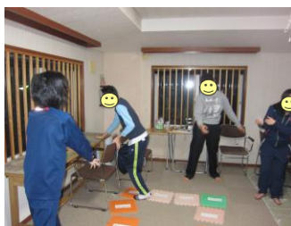
ラジオ体操で体づくり☆ 「いち、に、さん、し」♪