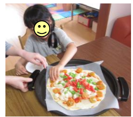
野菜をたっぷりトッピング! 「ここにのせようかな?」