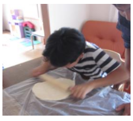
ピザ生地をのばし中。 すごい! その調子~!!