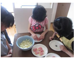
ベーコンを巻き巻き... とてもきれいにできました!

この日の昼食は「おにぎりランチプレート」! おにぎり、焼きそば、たまご焼き、ポテトのベーコン巻と皆が好きなものが盛りたくさん♪調理工程も、握ったり、炒めたり、巻いたり...と様々な工程があり、楽しみながら作っている様子が随所に見られました。出来上がったランチプレートは大好評! 「おいしい~」の音がたくさん聞かれ、残す人がほとんどいないほど、皆夢中でもりもり食べていました♪