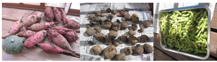
今年の収穫野菜たち♪どれも立派に育ってくれました (*^_^*) 初めて育てたかぼちゃが少し小さいのはご愛嬌☆後ほどハロウィーンで活躍します!