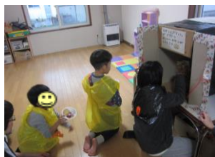
おばけ扉でおやつをゲット！ 指令をクリアできるかな？