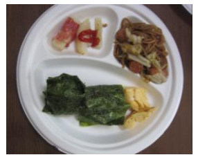
とてもおいしくできました。 みんな揃っていただきます♪