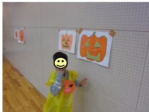
ハロウィーン福笑いゲーム！ かぼちゃの鼻はどこでしょう？！

10月の最終週は「ハロウィーンウィーク☆」ということで、ハロウィーンにちなんだイベントを行いました！今や秋の代表的なイベントとして定着しているハロウィーン☆ニコリでもハロウィーンイベントは大人気です♪コミュニティセンターの多目的ホールの広ーい空間を利用したハロウィーン福笑いや、ニコリ恒例の「おばけ扉」を使った、おやつがもらえるお楽しみゲームなどなど、室内装飾や仮装にもこだわった楽しい時間になりました！