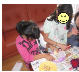
じゃがいもの皮むき、スライスに集中して取り組んでいます! 油で揚げたら大人気の手作りポテトチップスの出来上がり~!!