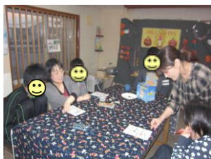
中高部ではハロウィーンビンゴで 盛り上がりました☆