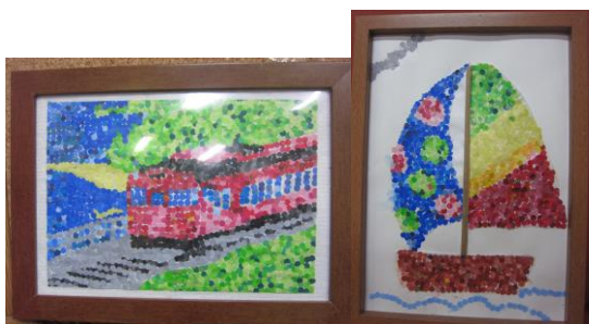
穴あけパンチで抜いたものを貼り見事な風景画を仕上げました！ 細かな作業を一つ一つ丁寧に頑張った力作です！