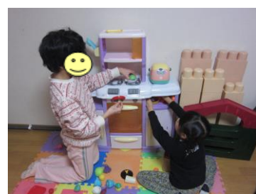
ままごと遊びに夢中☆今日のご飯は 何かな？！「はい、できましたよ～」