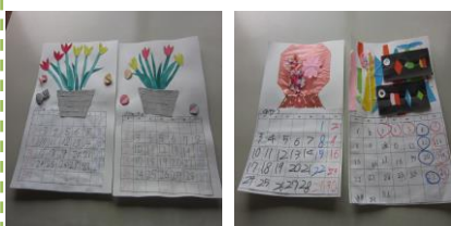
毎年取り組んでいるカレンダーづくり 左：中高部 右：小学部

ひとりひとりのできることや得意なことを活かしながら、時には苦手なことにもチャレンジして作り上げた作品はどれも力作ばかりです！！