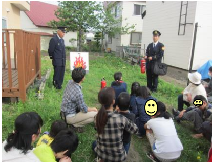
消火器の使い方をみんな真剣に聞いていますね！