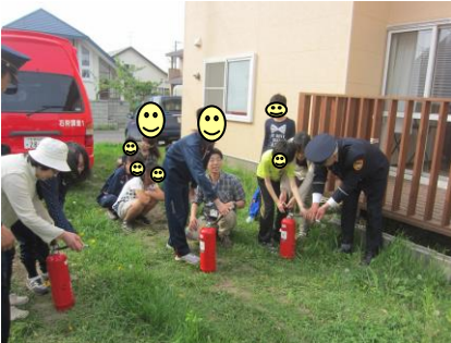
いざ、本番！ 消防士さんにおそわりながら全員が消火訓練に参加できました☆