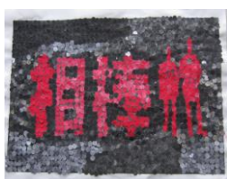
大好きなドラマのロゴを小さい円形の紙を使った貼り絵で作りました