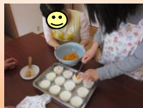
今日のデザートは 『杏仁豆腐♪』 みかんをのせたら はい、出来上がり☆