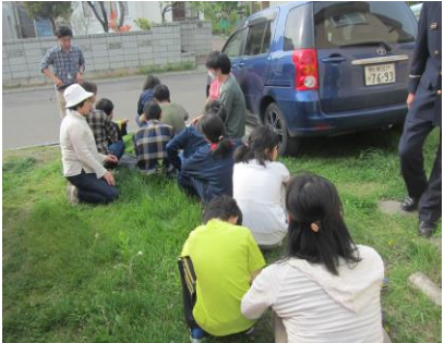
点呼 「全員、いますか！？」