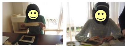
飾りをつけて、フォトフレームの完成☆