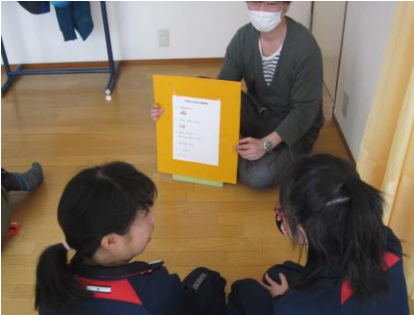
訓練前の説明 「お・か・し・も」の確認中

毎年、火事や地震などの災害時に備えて行っている避難訓練ですが、今回初めて消防署の方に立ち会ってもらい行いました。初めは緊張している様子だったみなさんも、いざ訓練が始まると真剣に取り組み、その姿を消防署の方にたくさんほめていただきました！ 訓練後には、より安全に日々の活動を行うために、部屋に置く物の場所をちょっと変えるだけで延焼の防止が期待できたり、被害を少なくできることを実際に活動部屋を見てもらいながらアドバイスをいただきました。さらに、初めて行った訓練用の消火器を使っての消火訓練では、火の絵が描かれたボードをねらって真剣に取り組む利用者さんの姿がとても印象的でした。訓練後には「消火器って意外と簡単に使えるんだね！」といった感想も聞かれるなど、いざ消火器を使わなければいけない事態になったときに「自分も消火に参加できる！」ということを知ってもらえる良い経験となった様子でした。