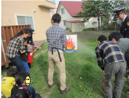
スタッフも全員体験しました☆