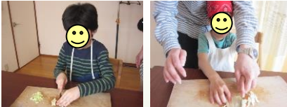
ハム☆キャベツ☆きゅうり☆ 包丁で具材を切る姿はみんな真剣！！