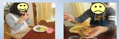
おにぎらず 焼きそばパン おいしくいただきま～す♪