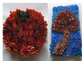
筒状に巻いた紙を貼りつけたみかんとシイタケ☆