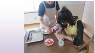
まきすを使ってのり巻き作りに挑戦！