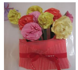
中高部共同制作 ペーパーフラワー